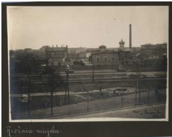
Rys. 2. Zakłady Mięsne Grudziądz S.A. w latach 40. XX wieku